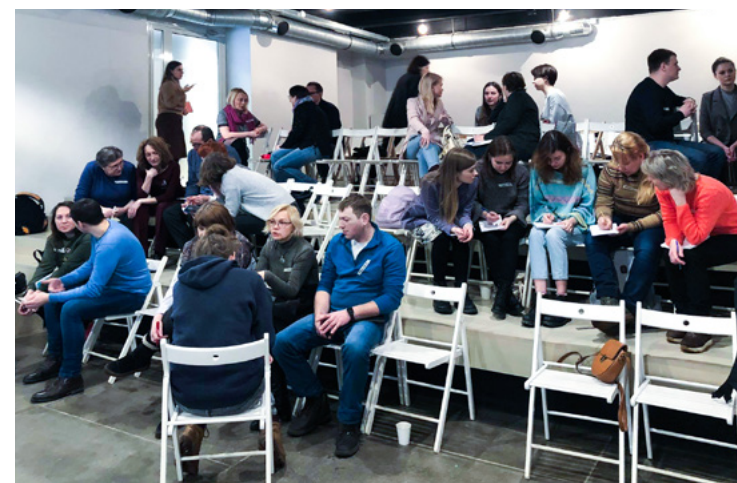
Проектирование инклюзивных инициатив. Пермь, 12.02.2020