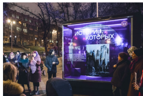
Открытие первой части выставки «Истории, которых не было» в Ильинском сквере