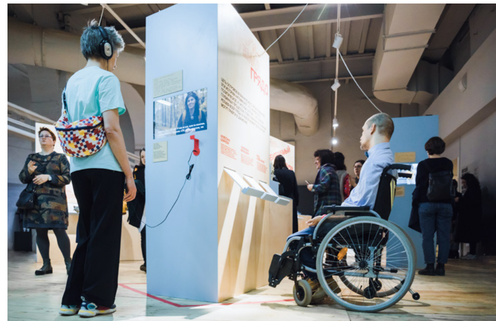
Открытие второй части выставки «Истории, которых не было» в Музее Москвы

Мне очень хотелось включить голоса самих героев и при разработке тифлогuida (гид на основе тифлокомментариев — подробных описаний, сопровождаемых блоками навигации, для незрячих и слабовидящих посетителей). Но к сожалению, когда мы подумали о такой возможности, аудиозаписи проведённых интервью уже были стёрты.