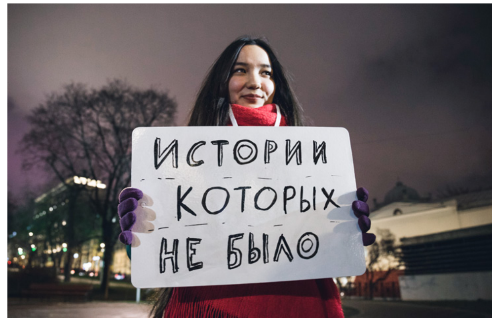
Открытие первой части выставки «Истории, которых не было» в Ильинском сквере

Однако как нам измерить и оценить это влияние? Как могла повлиять наша выставка на случайного человека, который не бывает в музеях и сторонится людей с инвалидностью? И как наше вовлечение героя с инвалидностью в проект поменяло его представления о музеях и культурных проектах, о самом себе, о собственных ожиданиях и планах? Эти вопросы подводят нас к заключительному этапу проекта — оценке, анализу и рефлексии.