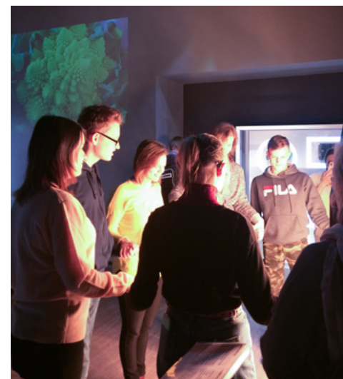
Экскурсия для глухих и слабослышащих людей на площадке экспозиции «Россия делает сама» (ВДНХ)

Ребята с кохлеарным имплантированием зачастую рождаются с сильной потерей слуха, который позже восстанавливается за счет медицинского вмешательства. Но как правило, они очень долго привыкают к слуху, и это не позволяет им естественно воспринимать речь и самостоятельно овладевать ею. То есть такие дети частично воспринимают обращенную речь на слух, но не сразу могут понять смысл сказанного. В работе с ними необходимо каждый раз проговаривать и закреплять сказанное. Они читают по губам, говорят с искажениями разной степени, но часто совсем не владеют РЖЯ.