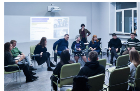
Дискуссия Политеха о методах вовлечения в культурные проекты, библиотека Шанинки

Участие в дискуссии представителей учреждений и посетительниц, передвигающихся на инвалидных колясках, привели к удивительному результату: обсудив проблемы в одном из музеев, участники договорились о дальнейшем сотрудничестве. Ведь чтобы начать работать вместе, людям иногда нужно просто встретиться. Одна из задач современного музея, на наш взгляд, — создавать пространство и условия для знакомств и совместных проектов разных людей.