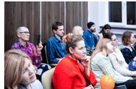
Участники конференции «Экспериментальные практики в работе с людьми с ментальными особенностями», организованной Политехом