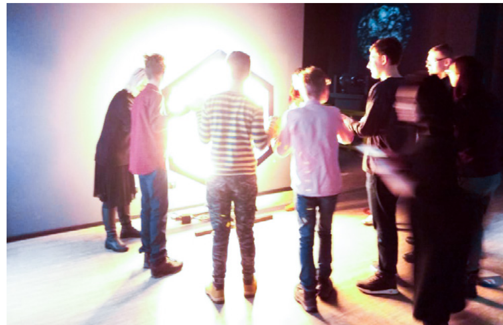
Экскурсия для глухих и слабослышащих людей на площадке экспозиции «Россия делает сама» (ВДНХ)

По сути переводчик — посредник между двумя культурами, он значительно упрощает коммуникацию внутри аудитории. Он обязан разбираться в культуре глухих, слабослышащих и кохлеарно имплантированных, обязан знать все особенности развития и обучения таких детей, чтобы не потерять их внимание во время экскурсии. Также при выборе переводчика важно учитывать его опыт работы: кандидат, который переводил судебные процессы, вряд ли сможет сразу приступить к работе в музее — в первую очередь из-за отсутствия навыков работы с аудиторией. Так что переводчик — совершенно незаменимый участник экскурсионного процесса, а выбор основного экскурсовода всегда за самим посетителем. Для нас это принципиально важный момент в диалоге музея и его гостя.