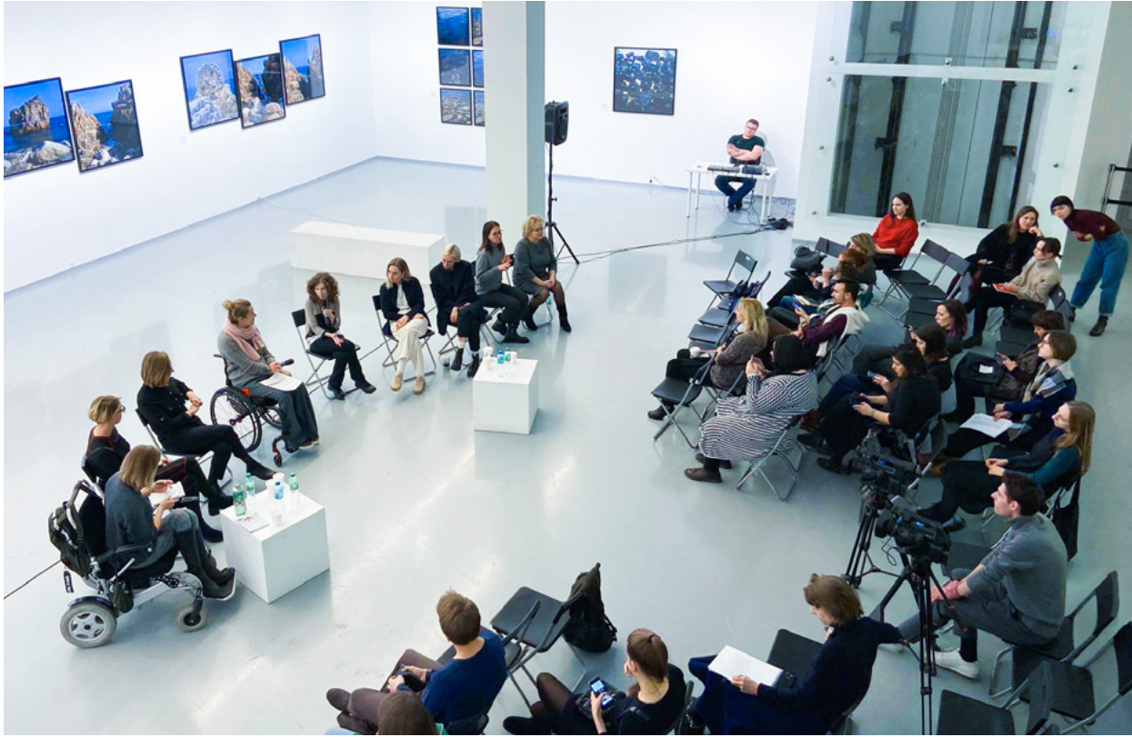
Дискуссия Политеха «Новый музей — старое пространство» в МАММ